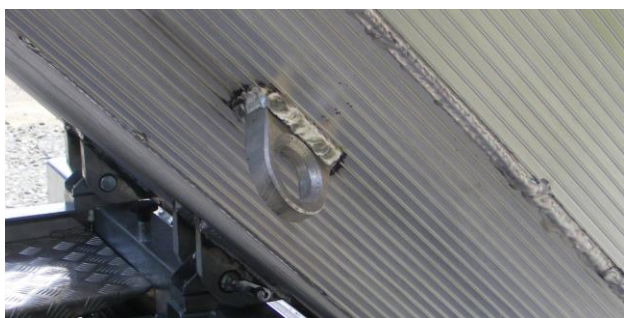
Zurrösen außenseitig auf abgeschrägtem Bereich