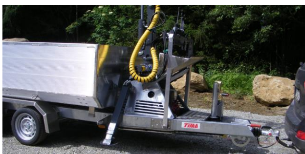
hydraulische Kranabstützung in A-Ausführung