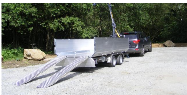
Auffahrrampen mit flachem Auffahrwinkel