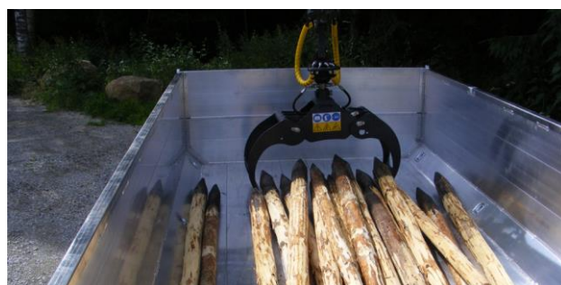
Be- und Entladen mit Kran