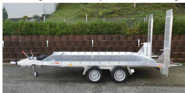
einteilige Auffahrrampen in Fahrstellung