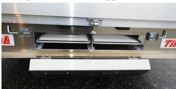
Rampeneinschub mit Klappe nach unten