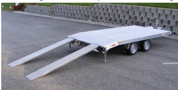
zweiteilige Auffahrrampen in Fahrstellung